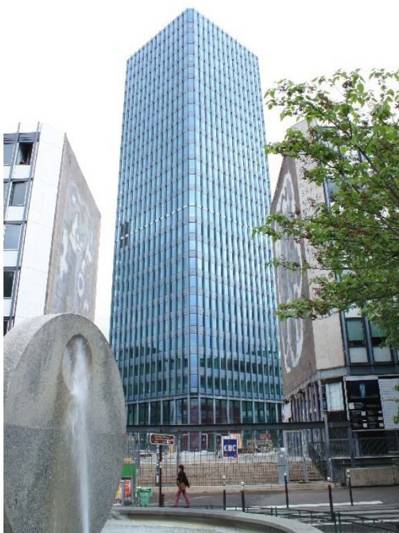
La Tour Zamansky

Plus de 200 personnels techniques et administratifs.