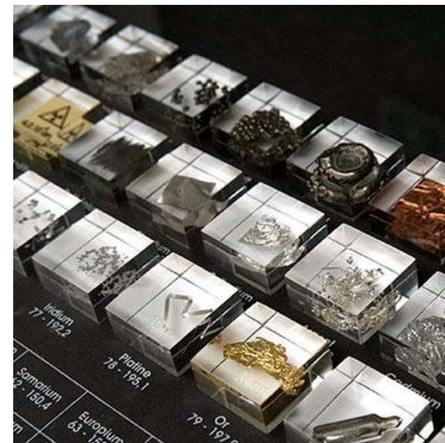
Sorbonne Université - Collection de minéralogie

Vos premiers contacts pour vos démarches administratives